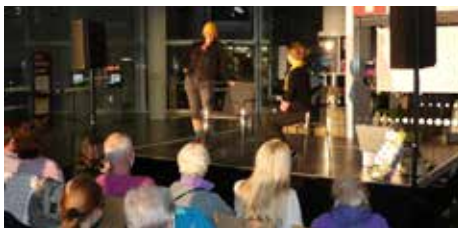
Die Tabutanten – Improvisationstheater