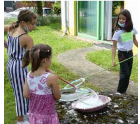
Eine Attraktion – riesige Seifenblasengebilde entstanden durch umfunktionierte Angelköcher

Endlich war es wieder soweit: Am 25. Juli fand der von allen Seiten lang ersehnte Familienbrunch des ambulanten Kinder- und Jugendhospizes Koblenz statt. Coronabedingt mussten wir im vergangenen Jahr eine Pause einlegen. Umso mehr Familien begrüßten wir dafür in diesem Jahr im Contel-Hotel Koblenz, wo der Brunch schon fast in guter Tradition stattfindet.