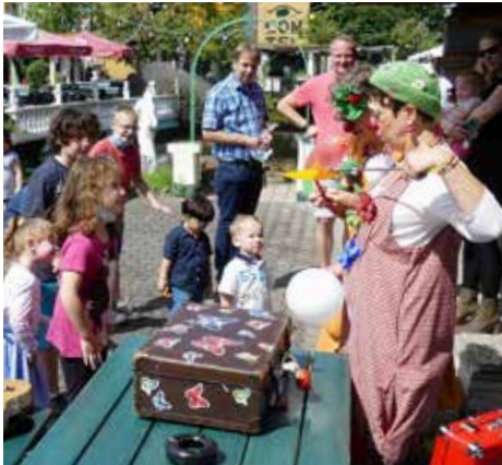
Nicht nur die Kinder, auch die Erwachsenen hatten viel Spass mit den Klinikclowns