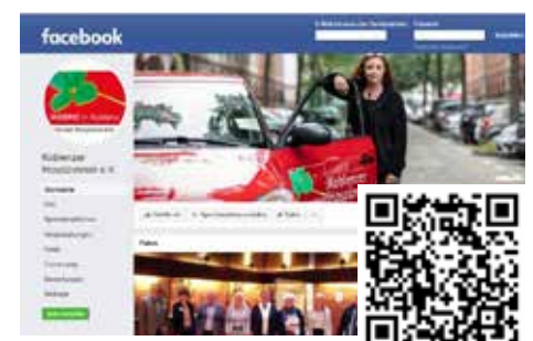
OR-Code zur Facebook-Seite