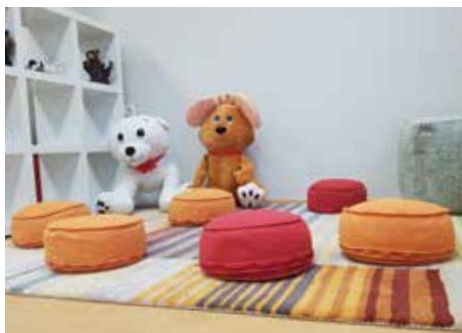
Die neugestaltete Sitzecke für Kinder ...

Für die Trauergruppen wurde der Raum im Erdgeschoss neugestaltet und für die Bedürfnisse für Kinder und Jugendliche eingerichtet. Es gibt sowohl eine Kinder- als auch eine Jugendsitzecke.