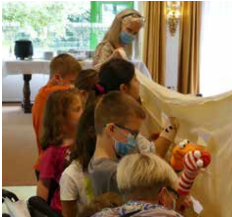
Die Kinder waren begeistert und konzentriert mit ihren gebastelten Handpuppen bei der Sache