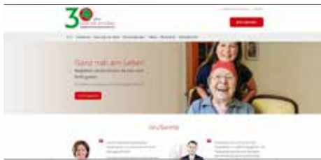
Minihomepage zum Jubiläum