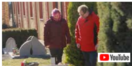
Video von einer Hospizbegleitungen auf YouTube